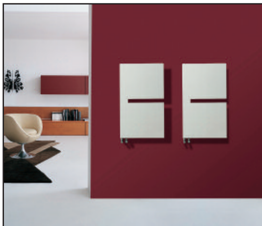
en foto: Sequenze S doble color Blanco Perla (cod. 16).

Para \Delta t diferentes de 50°C utilizar la fórmula: Q=Q_n (\Delta t / 50)^n