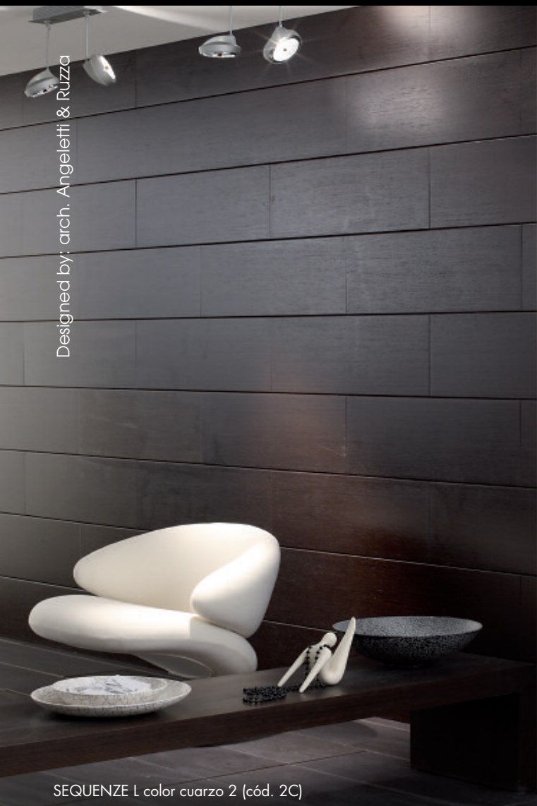
SEQUENZE L color cuarzo 2 (cód. 2C)