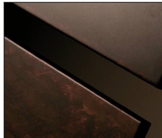
en foto: Particular Sequenze.